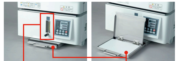
N 2 ガス導入装置(⑤)