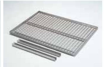
ステンレスパンチング