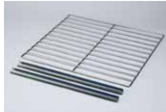
ステンレスワイヤ