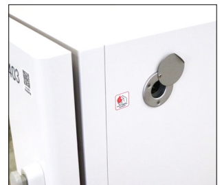
ケーブル孔30mm(標準装備・右側面)