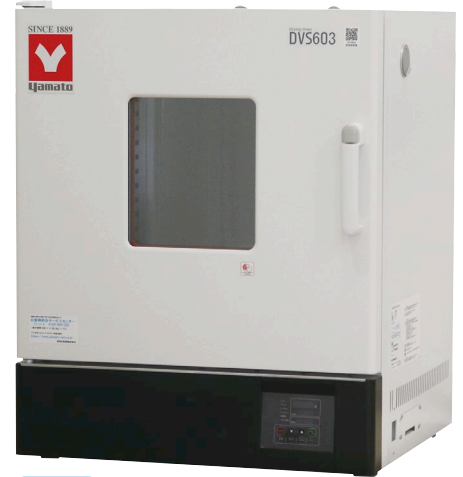
162L DVS603 ¥231,000 (税抜)