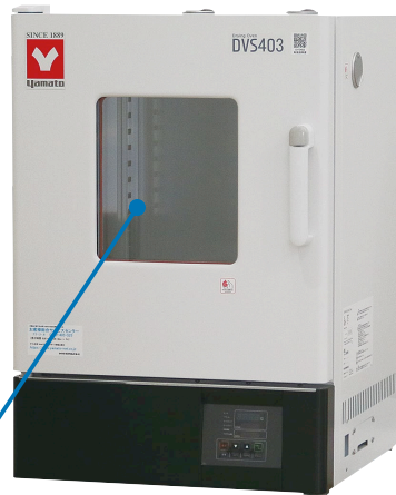
99L DVS403 ¥185,000 (税抜)