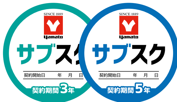
このステッカーが目印

実施しておりません。定期メンテナンスやIQ/OQをご希望の場合は有償にてお受けいたします。