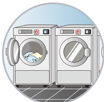
ランドリー室の二次汚染予防に