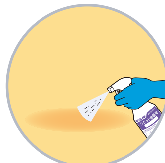
嘔吐物処理の除菌剤として