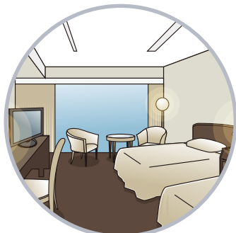
ゲストエリア、客室、バスルームなどの除菌とクリーニングを一度に