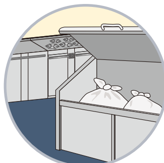
ギャベッジルームやゴミ箱などの除菌、消臭剤として