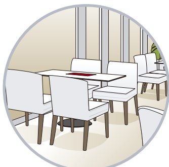
キッチン内に限らず、日常清掃用として