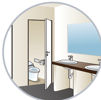
ノロウイルスの汚染源であるトイレ内での除菌洗浄として